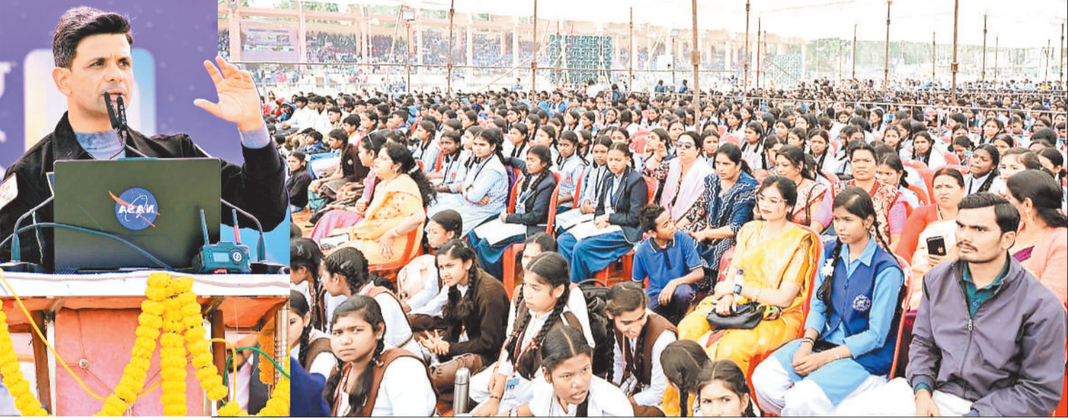
हरिभूमि न्यूज | जशपुरनगर

विज्ञान, नवाचार और राष्ट्र गौरव को अद्भुत छवि उस समय सजीव हो उठी जब भारत के अंतरिक्ष गौरव, भारतीय वायुसेना के ग्रुप कैप्टन एवं गणनायत्री शुभांशु शुक्ला का बुधवार को जशपुर आगमन हुआ। इस सम्मान में रणजीता स्टैडियम, जशपुर में 'इंडिया इन स्पेस' थीम पर अंतरिक्ष संगवारी कार्यक्रम का आयोजन किया गया, जिसमें जिले के लगभग 10 हजार विद्यार्थियों ने सहभागिता कर इतिहास के साक्षी बने। कार्यक्रम का उद्देश्य युवाओं और विद्यार्थियों में विज्ञान, तकनीक तथा अंतरिक्ष अनुसंधान के प्रति जिज्ञासा जागृत करना था। इस अवसर पर शुभांशु शुक्ला ने अंतर्राष्ट्रीय स्पेस स्टेशन में अपने 18 दिवसीय अंतरिक्ष प्रवास के अनुभवों को अत्यंत रोचक, सरल और प्रेरक अंदाज में साझा किया, जिसे बच्चों ने जिज्ञासु मन से गंभीरता और उत्साह के साथ सुना।